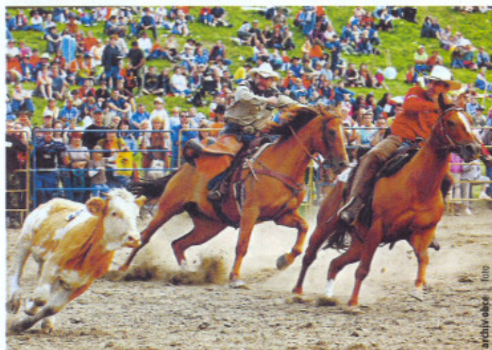
Muránske rodeo priťahuje tisícky nadšencov

V centre dedinky s 1 300 obyvateľmi nemôžete obísť krásny novogotický kostol, ktorý je skutočnou dominantou. Svojou vysokou štíhlou vežou akoby konkuroval skalným ihlám v Hrdzavej doline, vraj najkrajšej doline (ak vôbec možno o nejakom prírodnom kúte povedať, že je najkrajší) muránskych hôr. Neobíde ju určite žiadny turista smerujúci na Nižnú Klakovú, Kľak, na transmúrsku (Rudnú) magistrálu... Poteší aj pohľad na historickú budovu radnice, na uličky so starými domcami budovanými možno liptovskými vandrujúcimi murármi, na riekku Muráň,