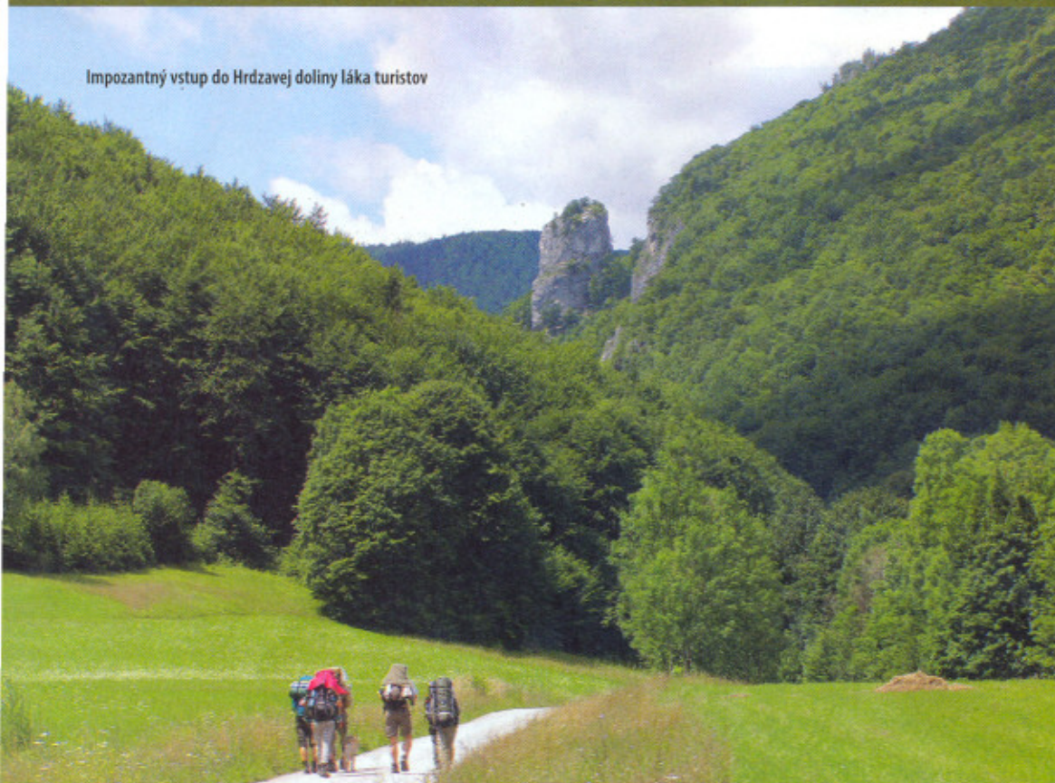
Impozantný vstup do Hrdzavej doliny láka turistov

parku Muránska planina aj nové Turistické a informačné centrum jeho správy. Tiež je viac zatvorené, ako otvorené. Takmer tri desiatky miliónov (vtedy ešte korún) na jeho realizáciu sa našli (aj keď viac v zahraničí), pár tisíc eur na jeho prevádzku akosi nie. Paradoxu súčasného „úsilia“ Slovenska o rozvíjanie cestovného ruchu. Odpustite ten malý nelichotivci exkurz. Sympatický Muráň si kritiku nezaslúži, len ľudia, ktorí sa k nemu správajú neúctivo, macošsky.